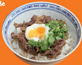
Beispiel: Sukiyaki Don

* gekochtes Rindfleisch mit Teriyakisoße ** paniertes Schweinefleisch mit Teriyakisoße *** gebratenes Hähnchenfleisch mit Teriyakisoße